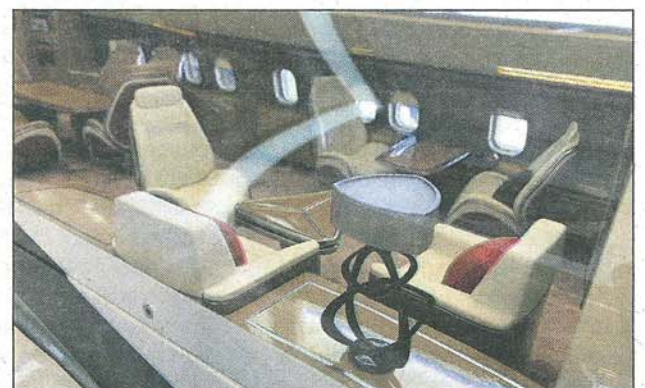
Un salon et un espace de réunion lumineux, grâce aux 275 sources de lumières