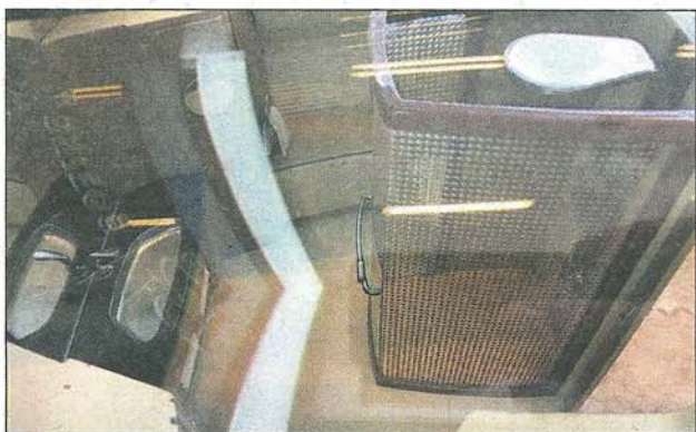
La maquette permet de découvrir la salle de bain avec douche du BBJ Max 7.