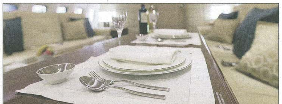
Daniela Boutsen est en charge de tous les objets visibles sur cette image.