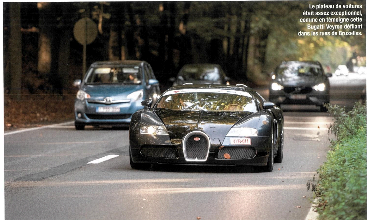
Le plateau de voitures était assez exceptionnel, comme en témoigne cette Bugatti Veyron défilant dans les rues de Bruxelles.