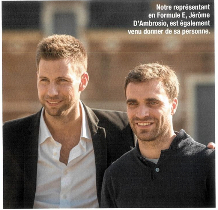
Notre représentant en Formule E, Jérôme D'Ambrosio, est également venu donner de sa personne.