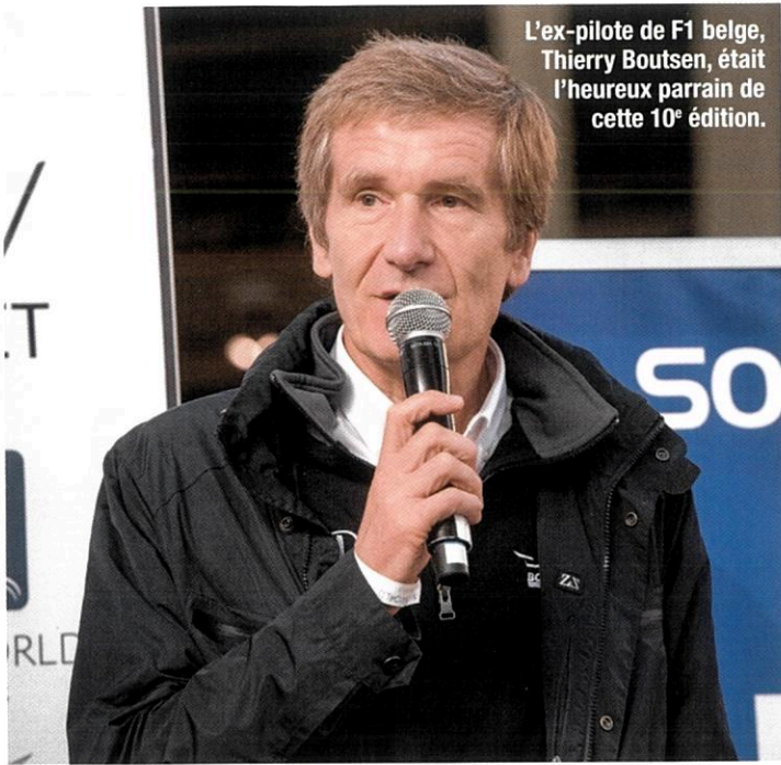
L'ex-pilote de F1 belge, Thierry Boutsen, était l'heureux parrain de cette 10 e édition.