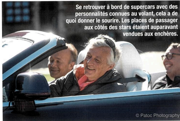
Se retrouver à bord de supercars avec des personnalités connues au volant, cela a de quoi donner le sourire. Les places de passager aux côtés des stars étaient auparavant vendues aux enchères.